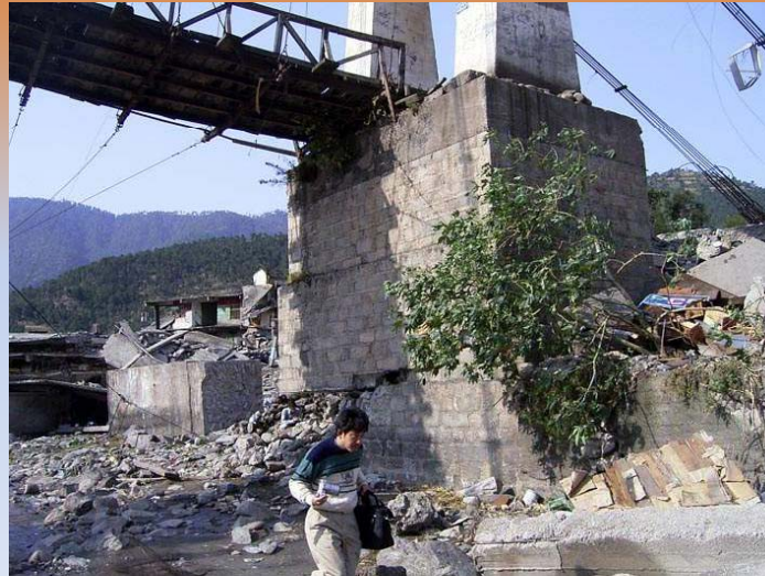
Balakot (Kashmir October 8, 2005)